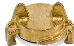
Dangtelis Cap for coupling Крышка