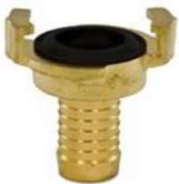
Jungtis į žarną Coupling with hose shank Соединение в шланг