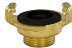
Jungtis su išoriniu sriegiu Coupling with male thread BSP Соединение с наружной BSP резьбой