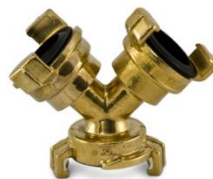
Y jungtis (trišakis) Y-piece for Geka coupling to make a by-pass Быстроразъемное соединение тройник