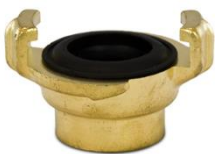
Jungtis su vidiniu sriegiu Coupling with female thread BSP Соединение с внутренней BSP резьбой