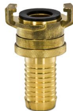
Jungtis į žarną su užraktu Coupling with locking ring and hose shank Соединение в шланг со стопорным кольцом